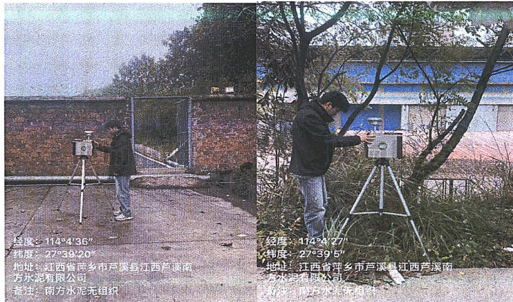
经度：114°4'36" 纬度：27°39'20" 地址：江西省萍乡市芦溪县江西芦溪南方水泥有限公司 备注：南方水泥无组织