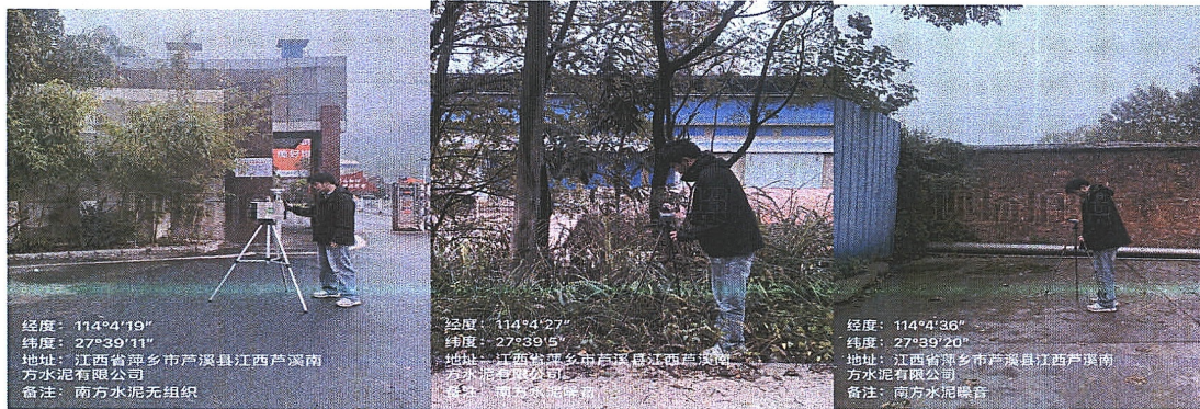
经度：114°4'19" 纬度：27°39'11" 地址：江西省萍乡市芦溪县江西芦溪南方水泥有限公司 备注：南方水泥无组织